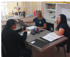
Equipe Pedagógica O.S.C - Instituto Evolução