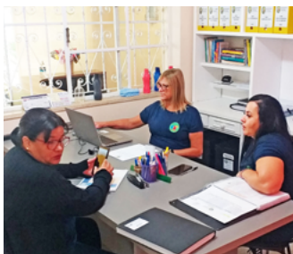
Equipe Pedagógica O.S.C - Instituto Evolução

Desde de maio de 2021 o Instituto Evolução firmou Termo de Colaboração com a Prefeitura Municipal de Santos, por intermédio da Secretaria Municipal de Educação, para organizar as "PAEIs" (Profissionais de Apoio Escolar Inclusivo). Uma parceria que deu muito certo. Página 3.